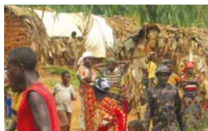
사업 시작 전 카루라마 마을 아동과 여성가장들