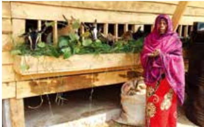
주민들이 함께 관리하는 카루라마마을 염소농장