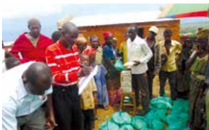
수확한 식량을 가구 별로 배분