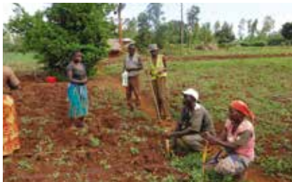
식량난 해결을 위한 카루라마마을 공동농업단지