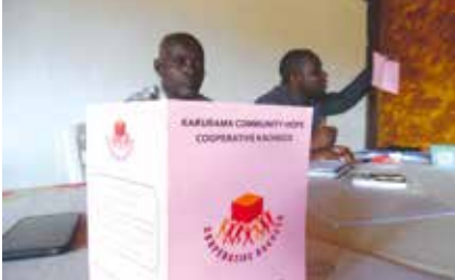
2016년 협동조합 설립