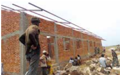
주민들이 함께 건축 중인 카그웨라마마을 초등학교